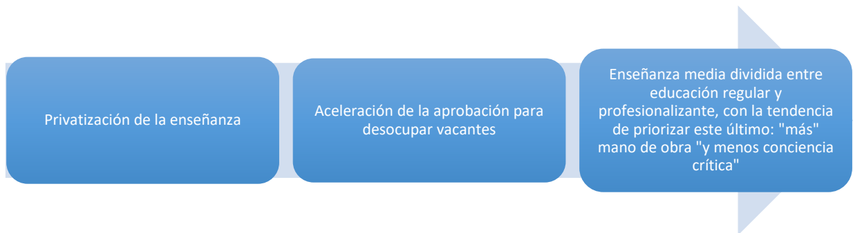
Tabela 3- La educación neoliberal

Sin la educación adecuada, los adolescentes no consiguen la inserción en el mundo que va a recibirlos tras cumplimiento de las medidas, haciendo que busquen otras formas de supervivencia, a través de actividades ilícitas, que acaban reinserciéndolos dentro del sistema socioeducativo.